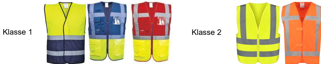
Beispiele für zweifarbige Westen, die der Norm EN ISO 20471 Klasse 1 entsprechen, und einfarbige Westen, die der Norm EN ISO 20471 Klasse 2 entsprechen

Deshalb entspricht eine vollständig grüne Warnweste nicht den Vorgaben. Zweifarbige Westen, Jacken oder Pullover können aber genutzt werden, wenn sie der Vorgabe entsprechen.