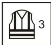
EN ISO 20471:2013